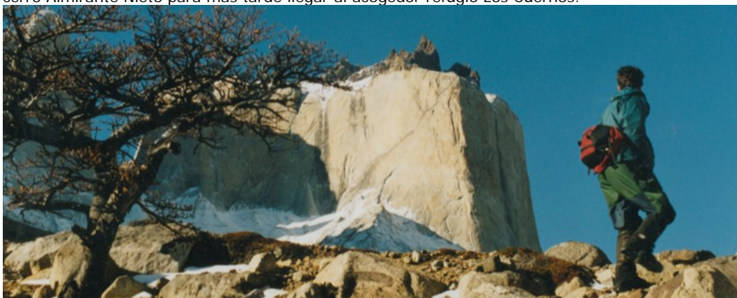
Los Cuernos en día 12

Día 11 Refugio Las Torres / refugio Los Cuernos 16km/ 5hrs trekking Hoy caminaremos a orillas del lago Nordenskjold y por debajo de los glaciares colgantes del cerro Almirante Nieto para más tarde llegar al acogedor refugio Los Cuernos.